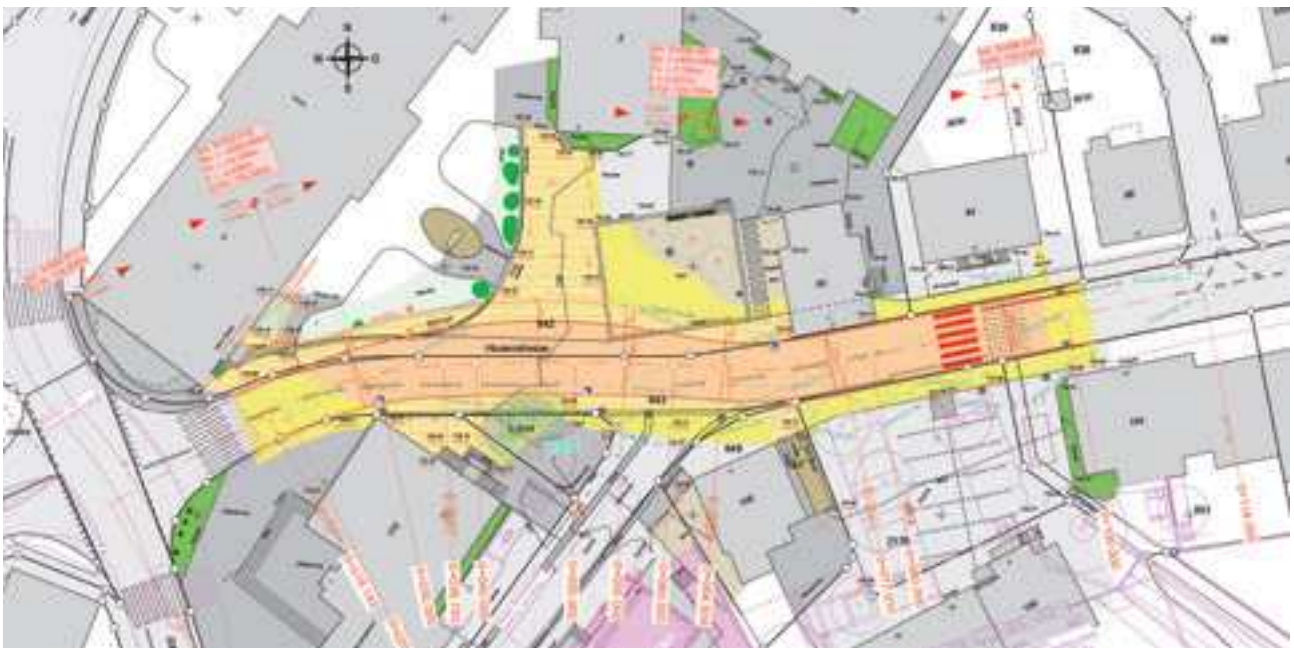
Situationsplan Verlegung Husenstrasse

Mit der Verlegung der Husenstrasse werden einerseits hinreichend grosse Radien für die aus der neuen Bushaltestelle ausfahrenden Busse geschaffen. Andererseits ist die Verlegung auch auf die spätere Umsetzung des BGKs abgestimmt. Die Einmündung der Husenstrasse soll im Rahmen des Kantonsstrassenprojektes angepasst und die Sichtweiten auf der Zentrumskreuzung optimiert werden. Durch die Verlegung wird zudem Raum geschaffen, damit Fussgängerinnen und Fussgänger auf einem Gehweg zwischen Gemeindehaus und Husenstrasse durchlaufen können. Heute grenzt das Gemeindehaus unmittelbar an die Husenstrasse. Somit kann auch für Fussgängerinnen und Fussgänger eine deutliche Verbesserung erzielt werden.