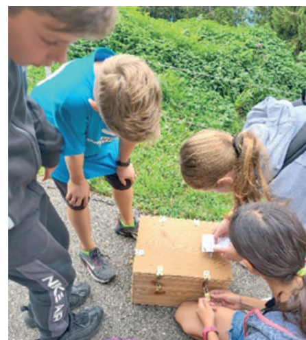
Rätsel-Schnitzeljagd am Niederhorn