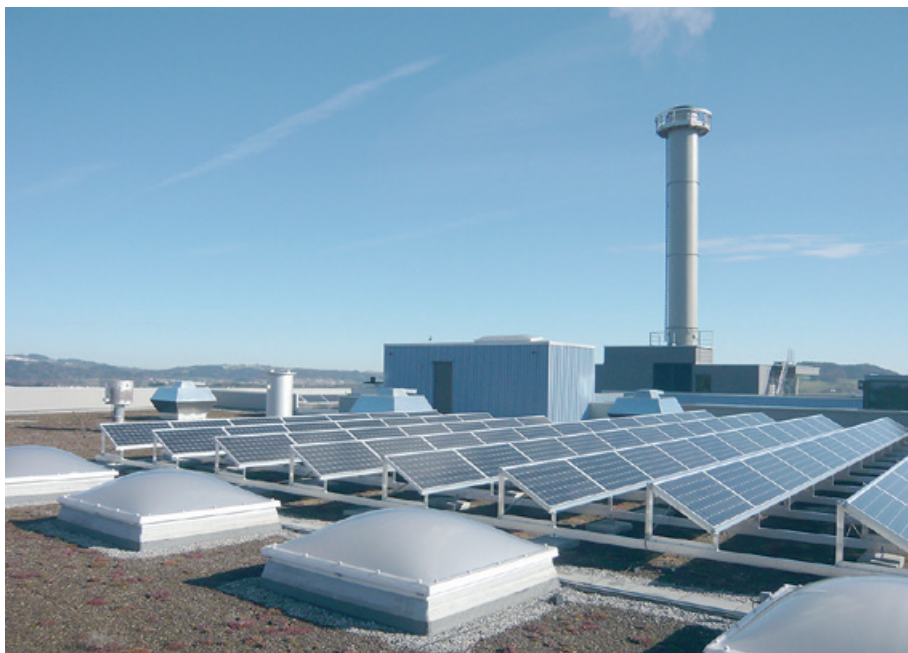
Energiepark Bazenheid mit erneuerbarer Energie aus unterschiedlichen Quellen: Energie aus Abfällen und Biomasse sowie Solarenergie aus den Photovoltaikanlagen

Die heutigen fossilen oder atomaren Energiequellen gehen unweigerlich zur Neige oder sind aus ökologischen Gründen fragwürdig. Langfristig betrachtet sind deshalb erneuerbare Energien der einzig gangbare Weg in eine nachhaltige energiepolitische Zukunft. Der Zweckverband Abfallverwertung Bazenheid (ZAB) versorgt seit dem Jahr 1976 benachbarte Industriebetriebe mit Prozesswärme, produziert seit 1984 zusätzlich auch Strom und in den vergangenen Jahren konnte in der Gemeinde Kirchberg ein Fernwärmenetz aufgebaut werden, welches mit Komfortwärme durch den ZAB versorgt wird. Noch vor wenigen Jahren stand beim ZAB die möglichst umweltgerechte Behandlung von Abfällen im Zentrum der