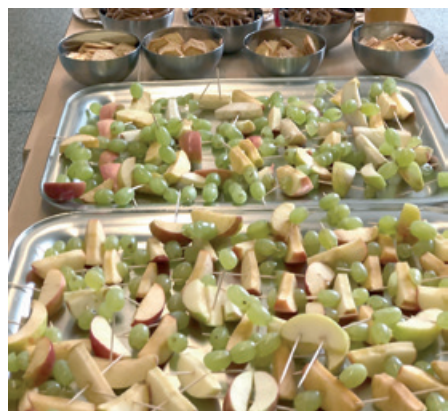
Buffet am J+S Jubiläum im Kindergarten Dorf – Früchte

verschiedene lustige Fallschirmspiele, welche allen viel Spass bereiteten. Zum Schluss durften wir, nach dem sportlichen Teil, ein reichhaltiges Znüni-Buffer genießen, welches alle vier Kindergartenklassen vorab vorbereitet hatten.