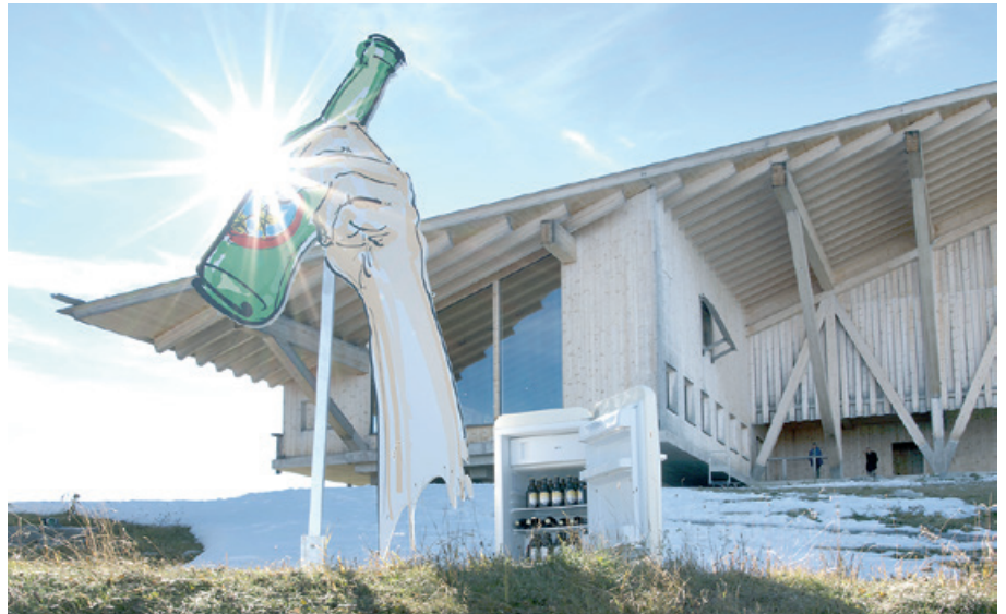
Astoose auf dem Chäserrugg (Region Toggenburg)

teils überraschenden Orten das Wir-Gefühl im Tal stärken. Auf Vorträge und Ansprachen wird verzichtet – das Beisammensein und der ungezwungene Austausch stehen im Fokus. Bei einem erfrischenden Bier aus der Brauerei St. Johann oder einem Toggenburger Öpfelsaft kommen Personen ins Gespräch. Es werden ganz ungezwungen neue Kontakte zwischen Menschen mit verschiedenen Hintergründen geknüpft. Ganz egal, ob diese per Zufall oder spezifisch an einem der geplanten Anlässe mit dabei sind, alles kann, nichts muss. Alle sind herzlichst eingeladen und die Teilnahme vor Ort erfolgt kostenlos und ohne vorherige Anmeldung.