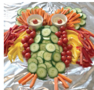
Buffet am J+S Jubiläum im Kindergarten Dorf – Gemüse

verschiedene lustige Fallschirmspiele, welche allen viel Spass bereiteten. Zum Schluss durften wir, nach dem sportlichen Teil, ein reichhaltiges Znüni-Buffer genießen, welches alle vier Kindergartenklassen vorab vorbereitet hatten.