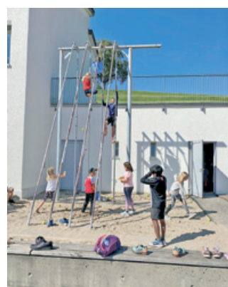
Hoch hinaus klettern