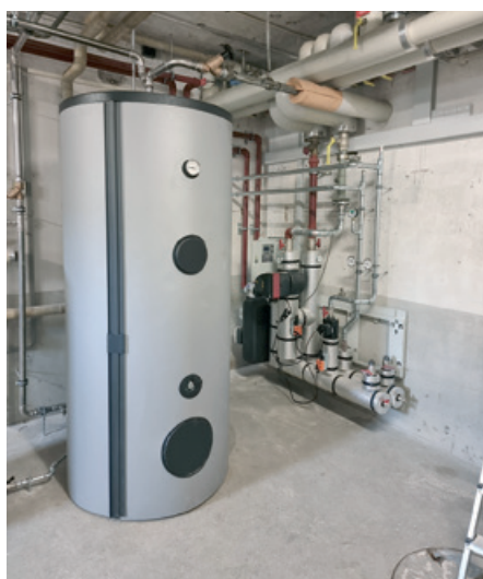
Anlage Fernwärme Sonnenhof