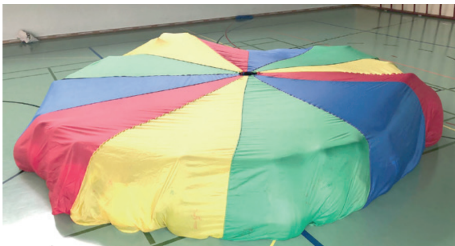
Fallschirmspiel Iglu am J+S Jubiläum im Kindergarten Dorf

Einen Teil des Morgens verbrachten wir in der Turnhalle. Zuerst tanzten wir alle gemeinschaftlich zu fröhlicher Musik durch die Halle. Anschliessend spielten wir mit den Kindern