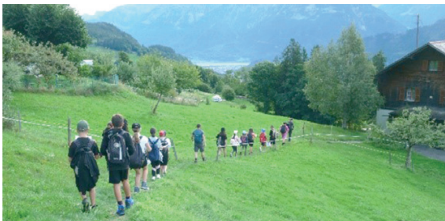
Foto-OL zu den Beatushöhlen

Am Mittwoch waren Köpfchen und Ausdauer gefragt bei der Rätsel-Schnitzeljagd am Niederhorn. Rund 300 Höhenmeter legten die Kinder