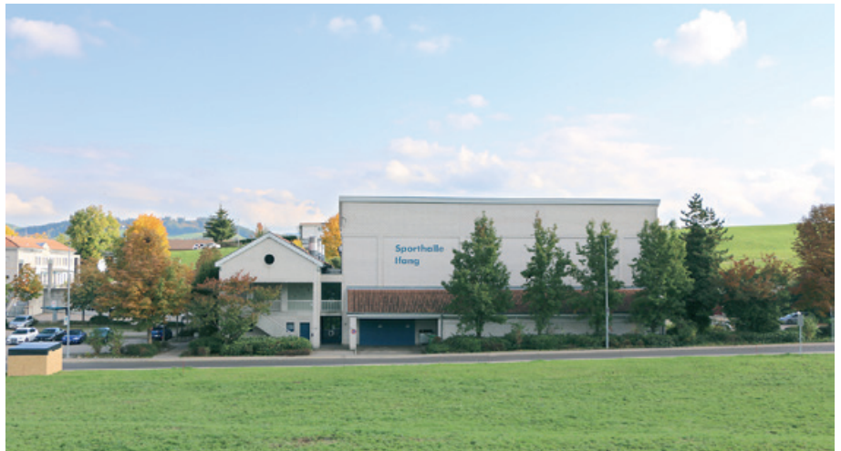
Mehrzweckgebäude Ifang, Bazenhaid

Vor der Einführung der Einheitsgemeinde auf das Jahr 2017 bestanden in den früheren Schulgemeinden und in der politischen Gemeinde verschiedene Reglemente und Tarife für die Liegenschaften. Die Liegenschaftskommission hat zur Vereinheitlichung und Vereinfachung ein Liegenschaftenreglement mit Gebührentarif für alle Liegenschaften der Gemeinde erarbeitet. Diese Erlasse konnten auf den 1. Januar 2019 in Kraft gesetzt werden. Seither konnten die Liegenschaftskommission und die anwendenden Stellen Erfahrungen mit dem Reglement und dem Gebührentarif sammeln. Diese Erfahrungen haben gezeigt, dass verschiedene Bestimmungen im Reglement verbessert werden können. Zugleich sollte die Struktur des Gebührentarifs vereinfacht werden. Mit einem II. Nachtrag zum Liegenschaftenreglement und einem neuen Gebührentarif wurden diese Verbesserungen umgesetzt. Die Änderung des Liegenschaftenreglements untersteht dem fakultativen Referendum (vgl.