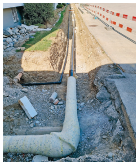
Anschluss Fernwärme Primarschulhaus Sonnenhof, Kirchberg