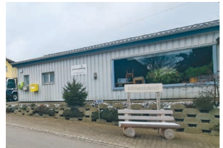
Hollenstein, Landstrasse 6, Dietschwil