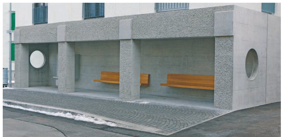
Bushaltestelle Zentrum Kirchberg

zeit kann es zu Lärm- und weiteren Immissionen kommen. Wir danken den Betroffenen für ihr Verständnis.