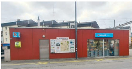
Kiosk Bahnhof, Bazenheid

Eine Übersicht aller öffentlich zugänglichen Defibrillatoren finden Sie hier: https://www.defikarte.ch/