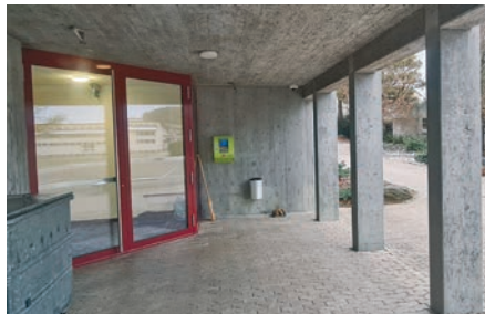
Turnhalle Lerchenfeld, Kirchberg

Eine Übersicht aller öffentlich zugänglichen Defibrillatoren finden Sie hier: https://www.defikarte.ch/