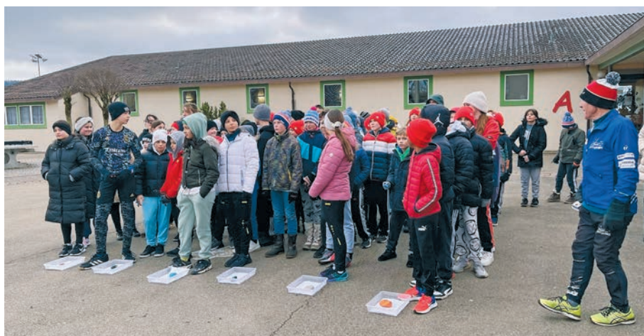
sCOOL – am Start

Alle gaben ihr Bestes, doch schlussendlich kamen nur drei in der jeweiligen Alters- und Geschlechtskategorie aufs Podest. Sie wurden mit viel Applaus und Wohlwollen verabschiedet. Alles in allem war es ein sehr gelungener Anlass. Was bleibt sind die Erinnerungen an einen grossartigen Tag. So bleibt vor allem eine Aussage eines Kindes hängen: «Es ist toll, mal zu rennen und den Kopf einzuschalten.»