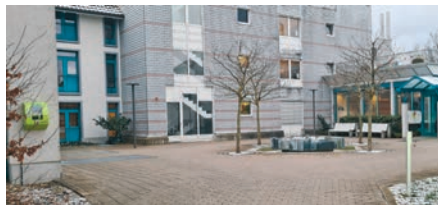
Sonnegrund – Haus für Betagte, Kirchberg