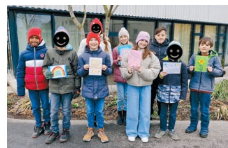
Schüler/-innen überbringen die Karten