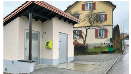
Trafostation, Chogelhuestrasse, Müselbach