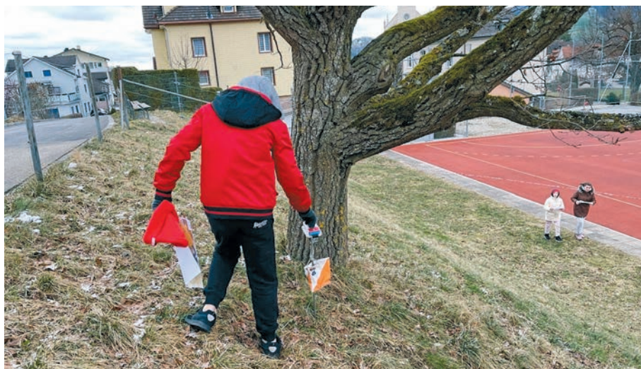
sCOOL – unterwegs