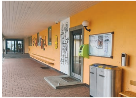
Schulhaus Eichbüel, Bazenheid

Die Politischen Gemeinde Kirchberg stellt an folgenden Standorten öffentlich zugängliche Defibrillatoren zur Verfügung: