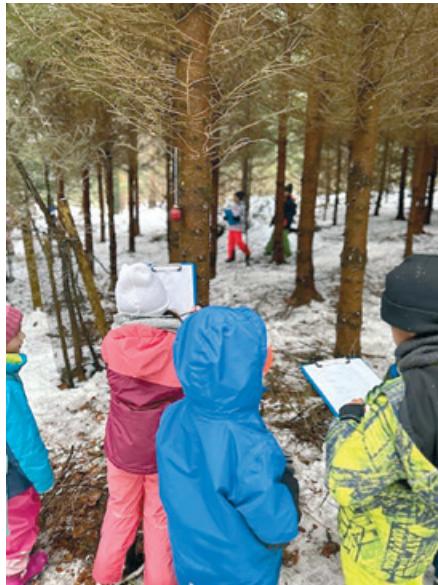
Die Kinder suchen die Waldgegenstände.

Im Wald angekommen, haben wir unsere Sachen deponiert und spielten ein Suchspiel. Wir konnten den Kleineren dabei helfen, die 14 Geschenke für den Samichlaus zu finden, welche davor von unseren Gspändli versteckt wurden. Während die einen am Spielen waren, haben fünf von der 6. Klasse mithilfe von Frau Güntensperger ein Feuer gemacht und darauf eine Sternli-Suppe gekocht. Nach der Suche gab es Suppe und wir durften im Wald alle zusammen spielen. Auf dem Nachhauseweg haben wir geholfen, die Sachen wieder hinunterzutragen und durften uns dann auf dem Weg verabschieden. Es war ein friedlicher