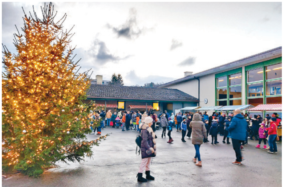
Der Weihnachtsmarkt war gut besucht.