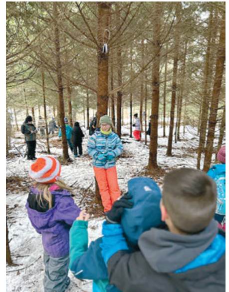
Die 6. Klässler helfen den Kindern der Unterstufe.

Tag, bei dem wir alle etwas erlebt und die Zeit im Freien genossen haben. Wir würden uns