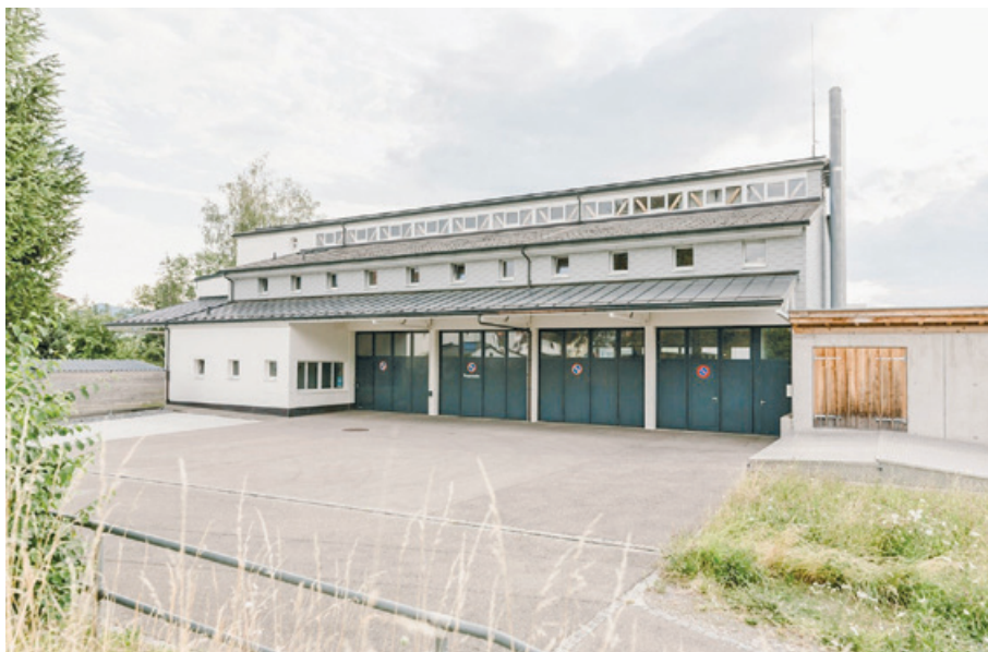
Im Feuerwehrdepot Lütisburg steht bald ein neues Tanklöschfahrzeug.

Um bei Einsätzen schnell und effektiv intervenieren zu können, hat die Feuerwehr Kirchberg-Lütisburg sowohl ein Depot in Kirchberg als auch einen Standort in Lütisburg. Für das Depot in Lütisburg ist für das Jahr 2024 der Ersatz des Tanklöschfahrzeuges geplant. Budgetiert wurde die Anschaffung des Fahrzeuges inklusive der Materialkosten und Ausstattung mit Fr. 507'600.–. Die Gemeinde Lütisburg beteiligt sich mit 15% an den Kosten. Subventioniert wird der Ersatz des Fahrzeuges zudem mit einem Beitrag der Gebäudeversicherung St. Gallen in der Höhe von Fr. 150'000.–. Die Ausschreibung für das neue Tanklöschfahrzeug läuft in diesen Tagen ab.