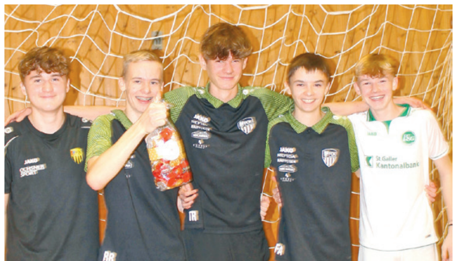
Das Team «ok.ch» durfte den Sieg des diesjährigen Chlausturniers verbuchen.

Energiestadt Kirchberg (SG) european energy award