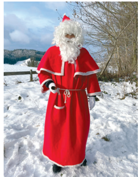
Der Samichlaus überraschte die Kinder.

Neugier stiegen an, als wir sogar den roten Mantel durch die Bäume entdecken konnten. Als die Kinder den Samichlaus erblickten, leuchteten ihre Augen und ihre Freude war zu spüren.