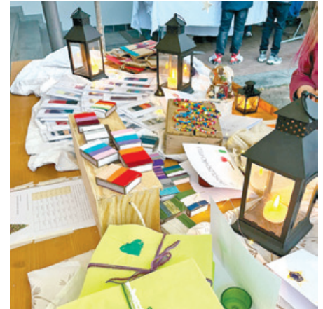
Die Auswahl an handgefertigten Artikeln war gross.

nen guten Zweck gespendet. Dieses Jahr ging der Erlös zugunsten der Organisation «Mutper-