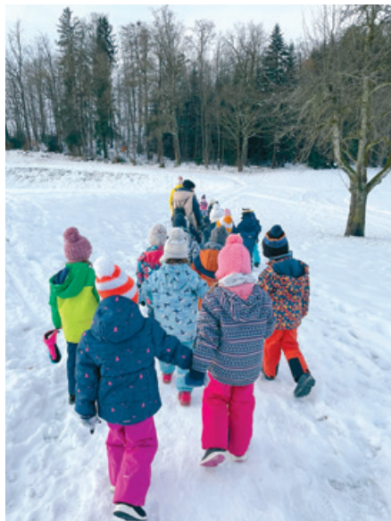
Die Kinder machten sich auf den Weg zum Samichlaus.