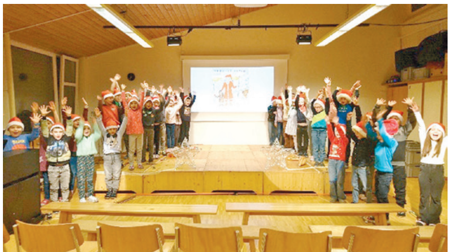
Die Schülerinnen und Schüler meisterten die Aufführung mit Bravour.

Die Kinder meisterten die Herausforderung mit Bravour. Die Lieder wurden toll gesungen und mit Klavier und Rhythmusinstrumenten begleitet. Die Texte mit lauter, deutlicher Stimme sicher vorgetragen. Alle Schülerinnen und