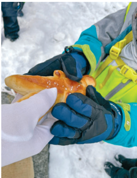
Jedes Kind erhielt einen Grättibänz.

Am Morgen des 6. Dezembers 2023 machten sich alle vier Kindergärten des Kindergartens Dorf auf den Weg, um den Samichlaus im Wald zu suchen. Wir spazierten auf dem Waldweg, als wir plötzlich Rauch aufsteigen sahen und ein Glöckchen hörten. Die Anspannung und