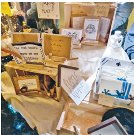
Selbstgefertigte Dekorationen der SchülerInnen.

len», die krebserkrankte Kinder und deren Familien unterstützt.