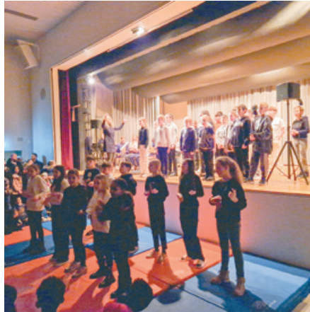
Das Konzert der MittelstufenschülerInnen vom Eichbüel.

Neben dem gelungenen Markt stand das soziale Engagement im Vordergrund. Die Einnahmen aus dem Verkauf der Artikel, nämlich 4'054.95 Franken, wurden grosszügig für ei-