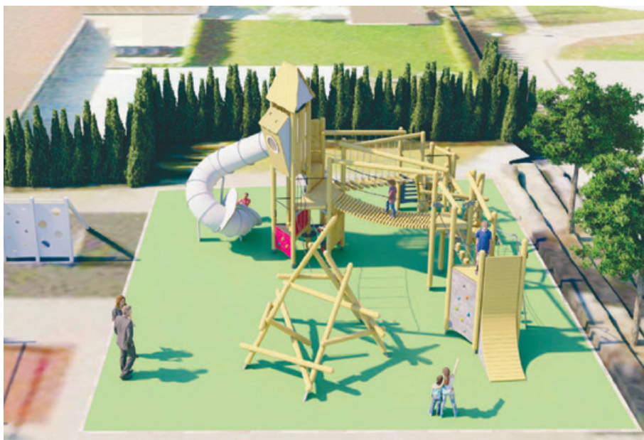
Der geplante Spielplatz verfügt über diverse Kletter-, Balancier- und Rutschmöglichkeiten.

Das Primarschulhaus Sonnenhof erhält dieses Jahr einen neuen Spielplatz. Dieser ersetzt den in die Jahre gekommenen bestehenden Spielplatz und entspricht den heute geltenden Sicherheitsanforderungen. Mit einem geplanten Bau während der kommenden Frühlingferien, können sich die Kinder voraussichtlich ab Ende April über die neue Anlage freuen. Geplant ist eine Spielanlage aus Holz mit diversen Klettermöglichkeiten, Seilübergängen, einer Hängbrücke, einer Rutschstange wie auch einer Röhrenrutsche. Für das Projekt ist ein Investitionskredit von Fr. 155'000.– im Budget 2023 bewilligt worden.