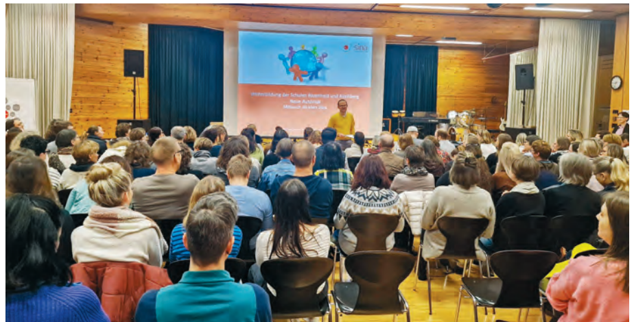
Einblick in das Impulsreferat für alle Mitarbeitenden der Schule

Ein Impulsreferat für alle Teilnehmende legte den Grundstein für intensive Diskussionen und Erkenntnisse an dieser schulinternen Weiterbildung. In den Workshops für Lehrerinnen und Lehrer, Klassenassistentinnen und Klassenassistenten sowie für die Mitarbeitenden der Schulsozialarbeit wurden praktische Strategien vermittelt, um eine positive Autorität im Schulalltag zu etablieren. Der Anlass war eine Bereicherung für das pädagogische Team.