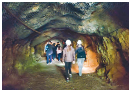
In der Asphaltmine

Jeden Tag hatten wir auch eine sogenannte «Tageschallenge». Am Montag war es die «Nicht-Lach-Challenge». Dabei mussten sich zwei Personen mit Wasser im Mund gegenüberstehen und durften nicht lachen – gar nicht so einfach! Am Abend gab es einen Spieleabend.