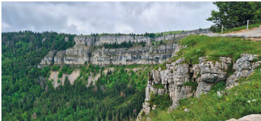
Creux du Van