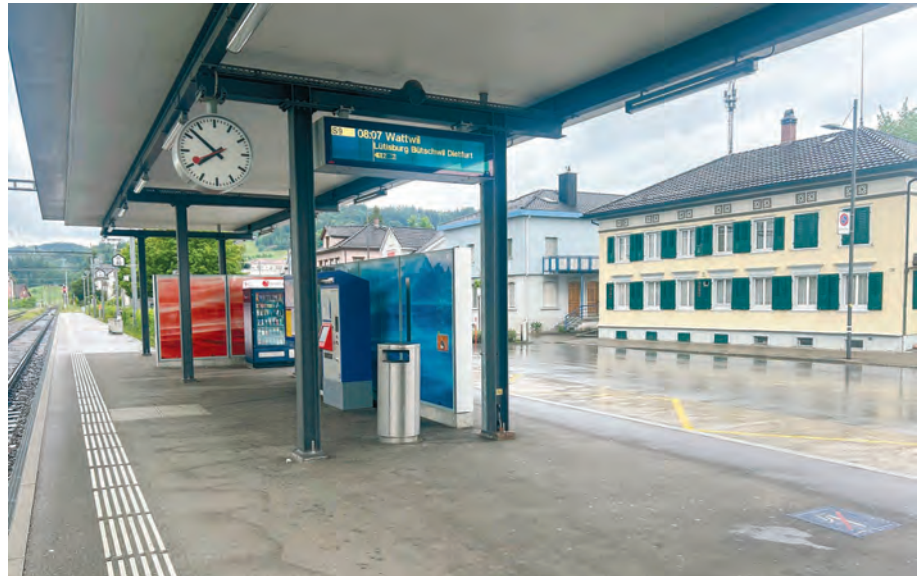
Der neue, dreiteilige Recyclingbehälter wird auf dem Perron des Bahnhofs Bazenheid platziert.

Seitens Gemeinde wurden die notwendigen Abklärungen vorgenommen und der Gemeinderat hat den Antrag behandelt. Gemäss Rücksprache mit den SBB sei zum aktuellen Zeitpunkt keine Recyclingstation für Alu und PET beim Bahnhof Bazenheid geplant. Für die Gemeinde bestehe jedoch die Möglichkeit, auf eigene Kosten selbst eine solche auf dem Perron zu erstellen. Die Verantwortung für die Betreuung und die Entleerung der Entsorgungsstation läge dabei bei der Gemeinde.