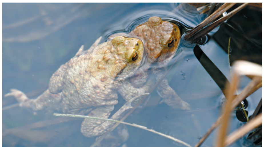
Die gefährdete Erdkröte ist eine von vielen Amphibienarten, die im Turpenriet auf sichere Verbindungswege angewiesen sind.

Das Turpenriet in der Gemeinde Kirchberg ist ein Flachmoor und gilt seit dem Jahr 1996 als Naturschutzgebiet. Mit dem vorhandenen «Eisweiher» zählt das Turpenriet seit 2001 zu den Amphibienlaichgebieten von nationaler Bedeutung. Jährlich wandern zahlreiche Amphibien, darunter auch stark gefährdete Arten, von ihren Winterquartieren zu den Laichgewässern und nach der Laichsaison wieder zurück. Bei einer Untersuchung im Jahr 2011 wurden 1'550 Amphibien bei den Amphibien-durchlässen gezählt.