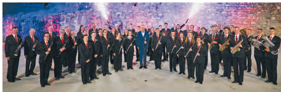
Die Blechharmonie Kirchberg

Energiestadt Kirchberg (SG) european energy award