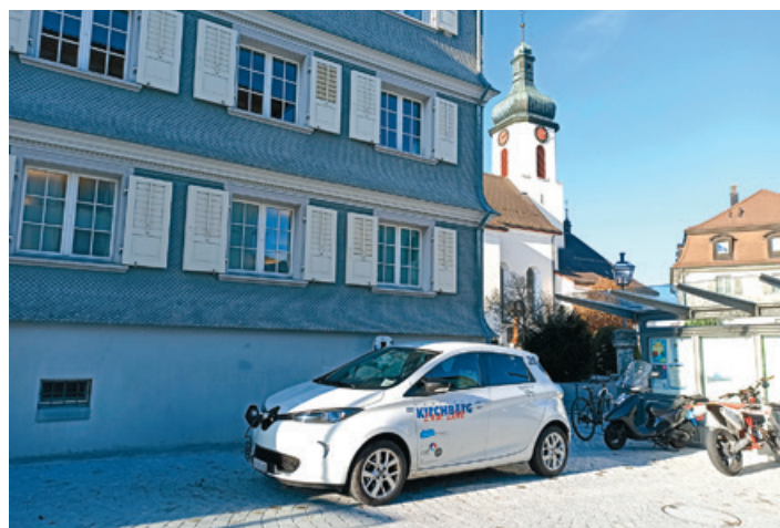
Der Kirchberger Sponti-Car ist zwischen dem Gemeindehaus und dem Volg parkiert.