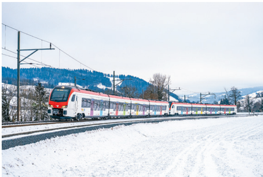
Der Flirt Evo fährt auf der S9 in Richtung Wil.

Nach intensiven Tests und Erprobungsfahrten hat der Flirt Evo am 25. September 2025 die Zulassung des Bundesamts für Verkehr für den kommerziellen Probebetrieb in der Schweiz erlangt. Thurbo will nun zusätzliche praktische Erkenntnisse erlangen, wozu die Fahrzeuge in kurzer Zeit möglichst viele Kilometer fahren und regelmässig um weitere Kompositionen verlängert oder verkürzt werden. Die S9 zwischen Wil und Wattwil erfüllt diese Voraussetzungen bestens. Diese Phase der Einführung nennt sich gelenkter Betrieb und wird durch Thurbo eng begleitet, sodass im Störfall rasch reagiert werden kann.