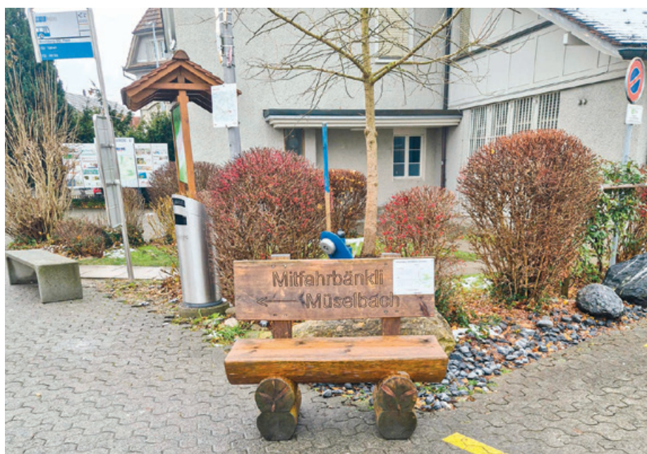
Das Mitfahrbänkli von Kirchberg nach Müselbach, beim ehemaligen Postplatz im Dorfzentrum Kirchberg.

Die Gemeinde machte sich daraufhin an die Umsetzung von Mitfahrbänkli für die Verbindung von Müselbach nach Kirchberg. Der Dorfverein Dietschwil dihei hatte zu diesem Zeitpunkt selbst bereits ein Mitfahrbänkli für die Verbindung von Dietschwil nach Kirchberg umgesetzt. Im Jahr 2023 startete für die Mitfahrbänkli in unserer Gemeinde ein dreijähriger Versuchsbetrieb, der noch bis Ende 2026 dauert. Nach Ablauf des Versuchsbe-