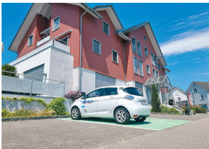
Der Bazenheider Sponti-Car ist beim Parkplatz des Restaurants Bären stationiert.

Mit diesem Angebot wird die Elektromobilität in der Gemeinde gefördert. Das Angebot eignet sich ideal für Einwohnerinnen und Einwohner, die nur gelegentlich ein Auto benötigen oder bewusst auf ein eigenes Fahrzeug verzichten möchten.