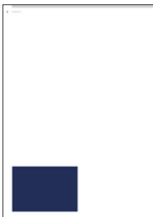
1/8 Seite 89.5 mm x 62 mm

Die Platzierung der Inserate erfolgt durch die Druckerei. Die Inserate werden farbig gedruckt ohne Randabfall.