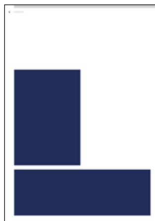
1/4 Seite Hoch: 89.5 mm x 129 mm Quer: 184 mm x 62 mm