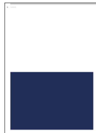
1/2 Seite 184 mm x 129 mm