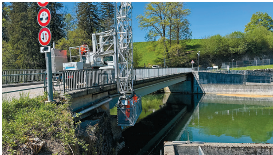
Am 30. April 2026 wurde eine spezialisierte Zustandsbeurteilung der Mühlaubücke mit Inspektion vor Ort durchgeführt.

Was an diesem Treffen bereits klar wurde ist: Die Platzverhältnisse sind äusserst anspruchsvoll und sehr eng. Schon die Spannweite dieser Rohrleitungsbrücke ist technisch eine Herausforderung. Sie muss in ausreichendem Abstand zur bestehenden Brücke erstellt werden, damit eine separate Hilfsbrücke für den Neubau später problemlos installiert werden kann. Auf der anderen Seite muss sie so nah an den bestehenden Strassen sein, dass sie mit verfügbaren Krans dorthin gehievt werden kann. Der Spielraum ist also sehr limitiert. Zusätzlich gilt es zu berücksichtigen, dass die neue Lösung künftig idealerweise auch Synergien für weitere Werkleitungen oder sogar für Fussgängerinnen und Fussgänger ermöglichen soll. Dafür sind, wie erwähnt, ordentliche Baubewilligungsverfahren erforderlich. Dazu können aus heutiger Sicht noch keine Aussagen gemacht werden. Die bei-