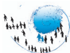
Evangelisch-reformierte Kirchgemeinde 9533 Kirchberg www.refkirchberg.ch