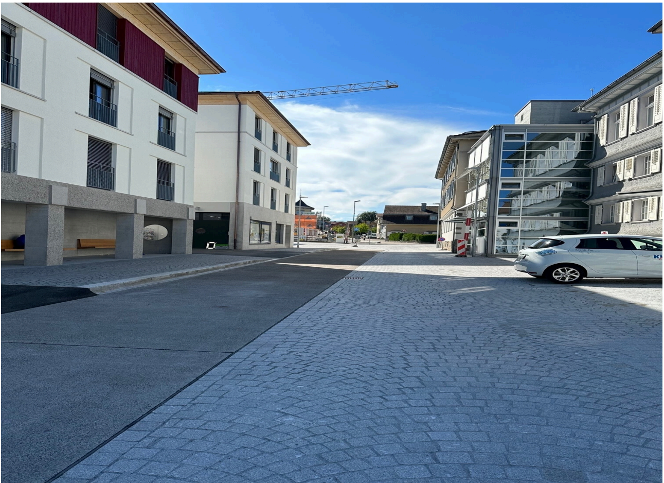
Neue Bushaltestelle und Strassenraumgestaltung Harfengrund

In den vergangenen Monaten wurden die Betonplatten für die neue Bushaltestelle zusammen mit der Strassenraumgestaltung zwischen Gemeindehaus und Zentrumsüberbauung fertiggestellt. Nachdem die Natursteinpflasterung überall ausgehärtet ist, kann die Strasse für den Verkehr freigegeben werden. Bis zur Inbetriebnahme der neuen Bushaltestelle wird die Strasse in Einbahnverkehr in Richtung Gähwilerstrasse geöffnet. Für einen Betrieb mit Gegenverkehr ist die Strasse nach dem Bau der Bushaltekante zu schmal. Nach der Inbetriebnahme der Bushaltestelle wird dieser Strassenabschnitt dann (nur noch) dem öffentlichen Verkehr und weiteren Berechtigten vorbehalten sein.